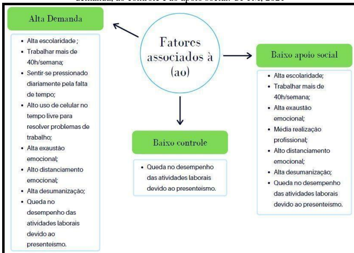
Figura 1 – Características sociodemográficas e de trabalho dos gestores associadas à demanda, ao controle e ao apoio social. UFTM, 2021