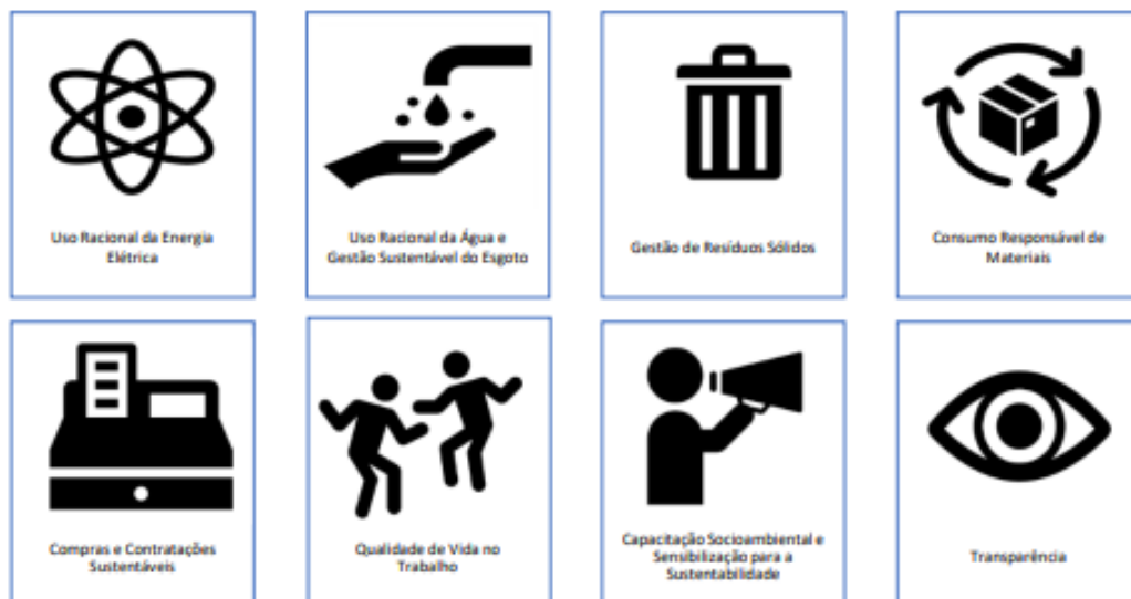
Figura 2 – Temas mínimos do Plano de Gestão de Logística Sustentável do Tribunal de Contas do Estado do Piauí

Buscando enfrentar as questões mais urgentes alinhadas ao DS, para dar uma maior efetividade as ações do PLS do TCE/PI, foram publicados os temas mínimos: uso racional da energia elétrica, uso racional da água e gestão sustentável do esgoto, gestão de resíduos sólidos, consumo responsável de materiais, compras e contratações sustentáveis, qualidade de vida no trabalho, capacitação socioambiental e sensibilização para a sustentabilidade, e transparência; totalizando 8 temas, conforme Figura 2 (TCE/PI, 2021):